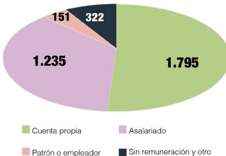
Gráfica 1. Posición ocupacional de los ocupados en el agro colombiano (2019). Cifras en miles de personas